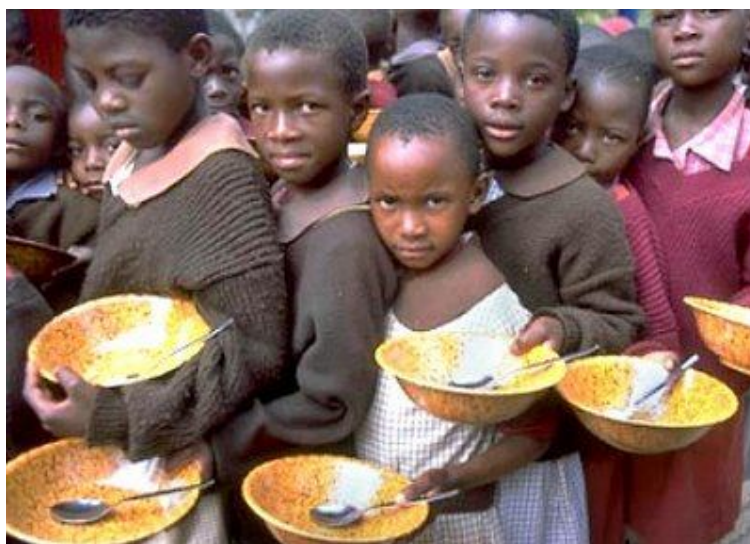
Uma campanha humanitária

1.000.000.000 DE PESSOAS VIVE COM FOME CRÔNICA E EU ESTOU LOUCO DE RAIVA. O QUE